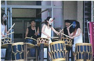
オープニングセレモニー (2023)